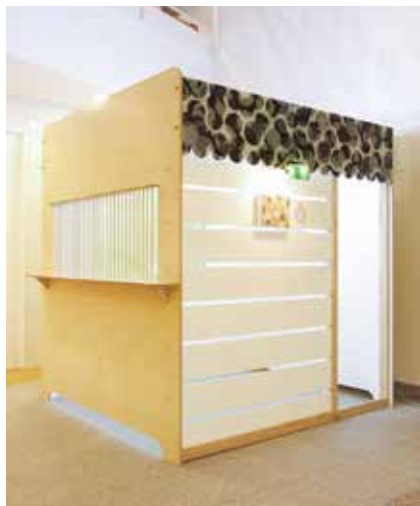
《TAKEDA system vol.009 - 山本雄基作品展 -》 @FIX・MIX・MAXI2(札幌宮の森美術館)/2008 ※参考作品