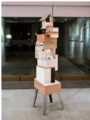
《神殿 - tree -》 mixed media H1,600 × W335 × D420 mm/2011 ※参考作品

※表面参考作品 《TAKEDA system vol.005 - LIVE & Exhibition -》 武田浩志(音) + 近藤寛史(音) + 大島慶太郎(映像) @ Utopia MoMo-Iro 2(CAI)/2006