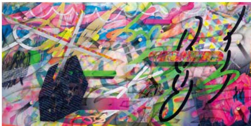
《Untitled》 木製パネル、アクリル絵の具、印刷物、金箔/H1,300 × W2,600 × D50 mm/2020 ※参考作品

ネオンカラーの描線がもたらす流動性、そして、透明メディウムの層が織りなす艶やかなテクスチャーなど、純粋な造形性によって見る者を魅了するその抽象絵画とあわせて、中庭空間に期間限定でしつらえられる武田特有のセンスが凝縮した「小屋」のたたずまいをご覧ください。